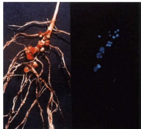
Rys. 1.2.1. Przykład luminescencji pozwalającej obserwować brodawki korzeniowe u soi dzięki wstawieniu genu nifD-luxAB , który koduje lucyferazę.