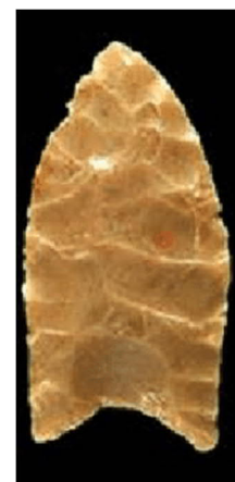
Rys. 1.1.1b. Ostrze kultury Clovis