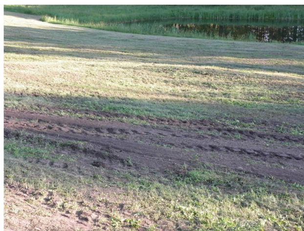
Rys. 3. Przykład dewastacji na skutek złego koszenia traw. Prowadzi to do erozji gleby i wymierania gatunków łąkowych.