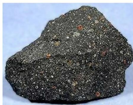
Rys. 1.1.1a. Meteoryt Murchinsona